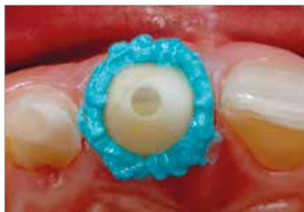
Application de VOCO Retraction Paste