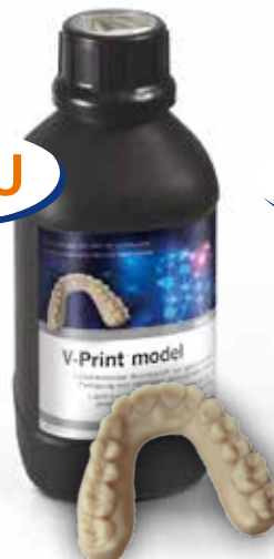
V-Print model Flasche 1000 g beige