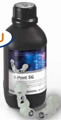
V-Print SG Flasche 1000 g clear