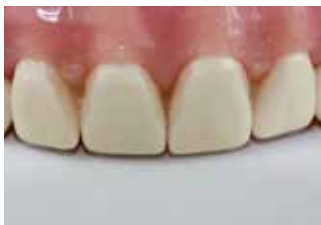
Aree interdentali bloccate