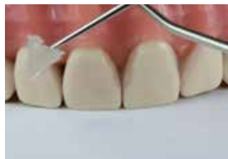
Rimozione di Clip Flow