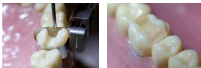
Applicazione di Clip alla cavità

Uno dei vantaggi di ogni prodotto della famiglia Clip è il suo facile utilizzo nella tecnica inlay / onlay. Dato che Clip può essere rimosso in un solo pezzo, non è necessario usare una fresa per rimuovere l'otturazione provvisoria dalla cavità. Quindi, la cavità rimane inalterata e non vi sono influenze negative sull'adattamento del restauro definitivo.