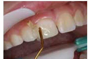
Restauro della forma e funzione del dente