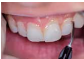
Applicazione della protezione gengivale