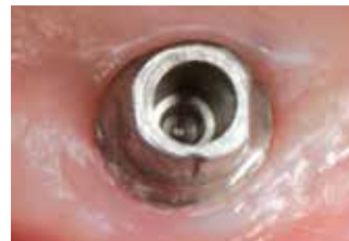
Moncone con foro d'accesso aperto

L'applicazione di Clip Flow è adatta per la protezione dei denti e la gengiva per esempio all'uso di sbiancamenti sul poltrona. Si comporta come una barriera per sbiancamenti e protegge in questo modo il tessuto molle circostante e i denti che non sono da sbiancare. La protezione della gengiva con Clip è molto facile e veloce.