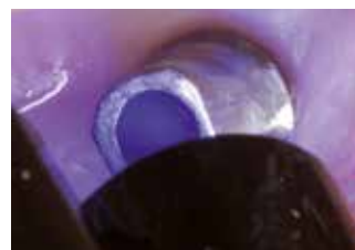
Fotopolimerizzazione del materiale