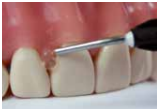
Applicazione di Clip Flow

Clip Flow rende possibile una fissazione semplice di matrici in plastica per garantire l'adattamento ottimo durante l'applicazione dell'otturazione.