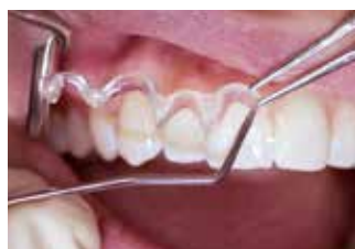
Rimozione in un solo pezzo