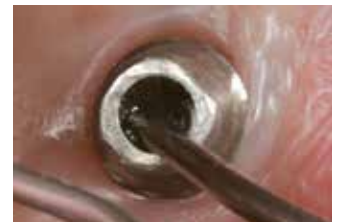
Foro sigillato con Clip Flow