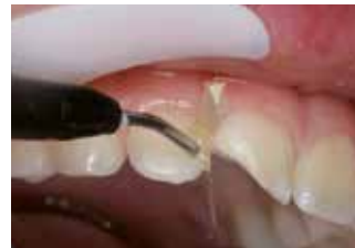
Fissazione della matrice