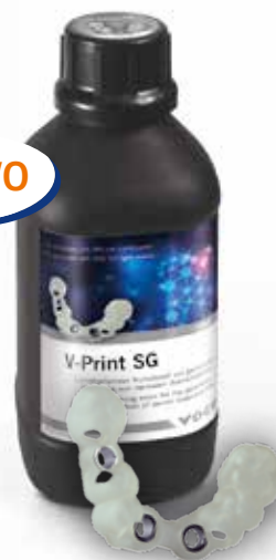
V-Print SG Flacone 1000 g clear