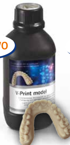
V-Print model Flacone 1000 g beige