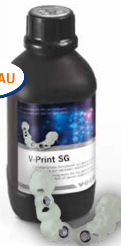
V-Print SG Flacon 1000 g clear