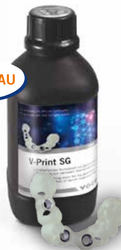
V-Print SG Flacon 1000 g clear