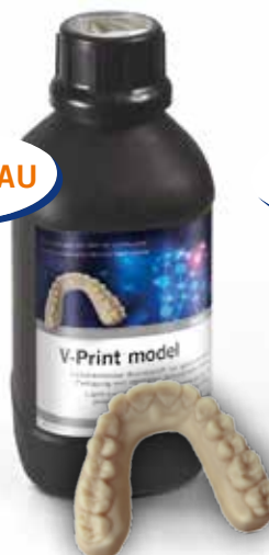
V-Print model Flacon 1000 g beige