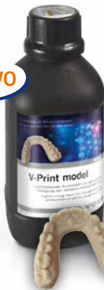
V-Print model Frasco 1000 grs. beige