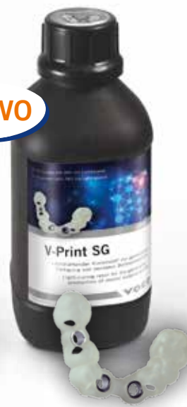
V-Print SG Frasco 1000 grs. clear